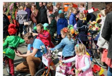
Voor wie is het?