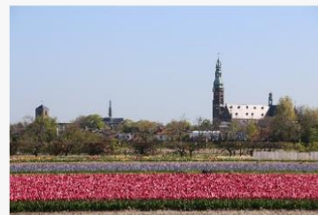
Wat is het?