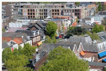
Hoe werkt het?

Op deze website vindt u meer informatie over het Ondernemersfonds en hoe u gebruik kunt maken van dit fonds.